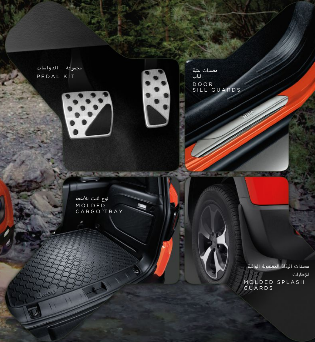
مجموعة الدواسات PEDAL KIT